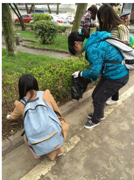
“向雷锋同志学习” 53 周年纪念日----工商 131 班团日活动