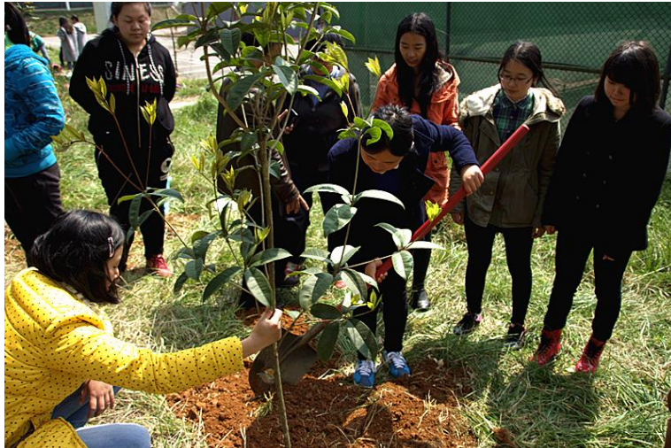
管理学院会计 131 班-3.5 学雷锋暨植树活动