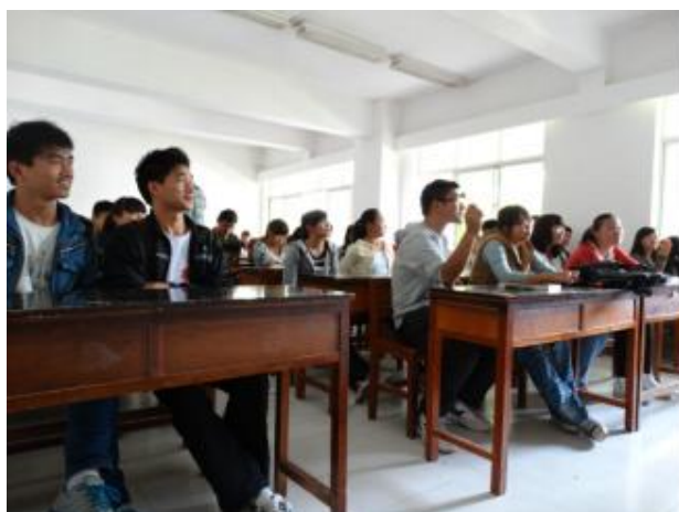
管理学院工程管理 131 班-3.5 学雷锋班团活动