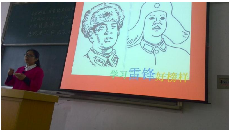
市场营销 141 - “学习雷锋精神，引领青年风尚”主题团日活动活动