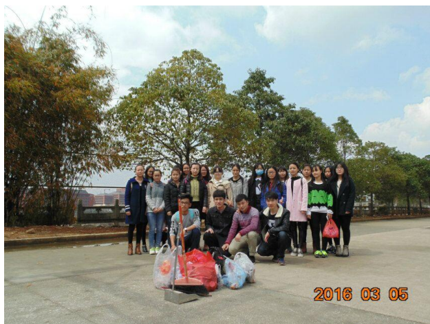
管理学院财管 141 班-3.5 学习雷锋、清洁校园团日活动