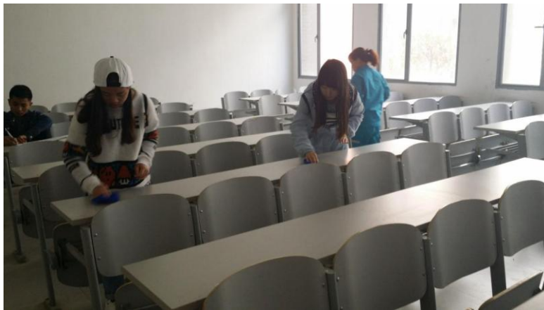
管理学院会计 141 班-3.5 学雷锋，美化校园行动